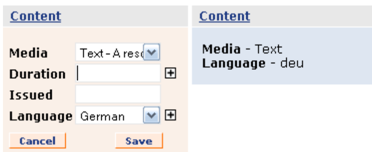
Abb. 3: Der aktivierte «inplace-editor» für die Informationsgruppe «Content». Die vorgesehenen Metainformationen werden sichtbar und editierbar, hier wird die Sprache «German» erfasst.