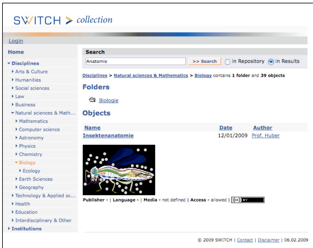
Abb. 1: Die Ansicht des SWITCH LOR-GUI, in der Beta-Version, wie sie für die Usability-Tests vorlag. Es besteht die Möglichkeit das «browsen» in den Kategorien mit dem Suchen zu kombinieren. Die Suche kann im ganzen LOR oder in der angezeigten Resultatliste erfolgen. Abgebildet ist ein Suchtreffer nach der Suche nach «Anatomie» innerhalb der angezeigten Kategorie «Biology».